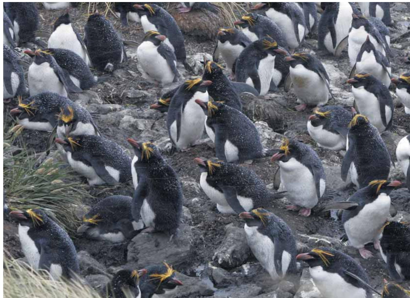
unten: Mit 2,7 Millionen Brutpaaren sind die Goldschopfpinguine die grösste Population auf South Georgia.

Die alten Walfänger haben nicht nur rostige Schiffe hinterlassen. Um nicht auf ihre gewohnte Nahrung zu verzichten, setzten die Walfänger Rentiere aus. So hatten sie genügend Frischfleisch. Noch heute grasen die Nachkommen jener «Rentier-Importserie» auf der Insel, mittlerweile sind es über 2'000 Tiere. Die durch den rigorosen Walfang entstandene Reduzierung des Walbestandes in den südantlantischen Gewässern ist ein Grund dafür, dass es den Robben so gut geht: Die Nahrung der Wale basiert ebenso wie die der Robben auf Krill. Durch den Rückgang der Wale finden die Robben jetzt Nahrung im Überfluss. So hat vor allem die Population der Pelzrobben in Besorgnis erregendem Ausmass zugenommen. An einigen Buchten liegen die Tiere so nah zusammen, dass die Pinguine fast nicht mehr zu ihren Kolonien durchkommen. Die Seeelefanten sind die grössten unter ihnen, sie sind wahre Kolosse. Die Bullen werden