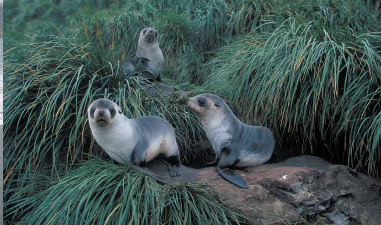
oben: Im Tusockgras sitzend bevölkern junge Pelzrobben die steilen Hänge von South Georgia.