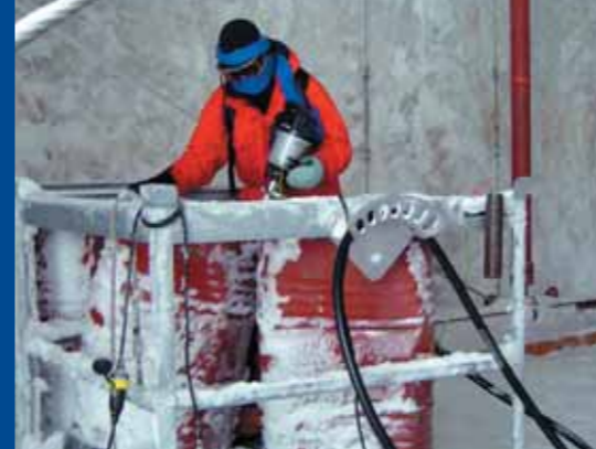
Vor jedem Ausflug werden die Skidoos voll getankt.

wir täglich eine Stunde eine der Umgebung angepasste Sportart ausgeübt. Neben diesen Gruppenaktivitäten muss Raum sein für persönliche Freundschaften, aber auch für den privaten Rückzug. Der Umgang mit Konflikten erfordert ein breites Spektrum an «Methoden». In manchen Situationen ist es sinnvoll, einen Konsens anzustreben. Jedes Jahr aufs Neue ist die sogenannte Sturmregelung Anlass für Konflikte: Bei über 50