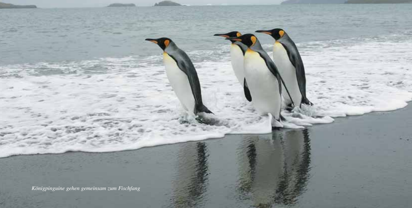
Königpinguine gehen gemeinsam zum Fischfang