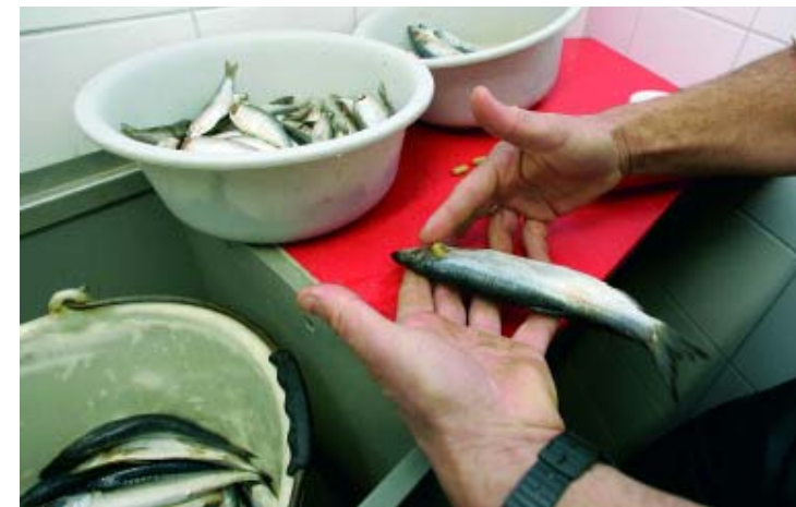
Sorgfältig präpariert Bruno Gardelli für jeden Pinguin einen Hering mit einer Vitamin- und Mineralsalz-Tablette. Er steckt sie den Fischen unter die Kiemen.

Wo viel Freude ist, da ist auch Leid. Manchmal wird ein Pinguin krank oder stirbt. «Es macht mich immer wieder traurig, wenn ein Pinguin stirbt. Ich frage mich dann, ob ich ihn vielleicht besser hätte pflegen können oder eine Krankheit verhindern. Aber der Tod gehört halt zum Leben.» Jedes Tier im Zoo, das stirbt, wird medizinisch untersucht.