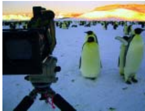
Gwandrige Kaiserpinguine inspizieren das ungewohnte Treiben.