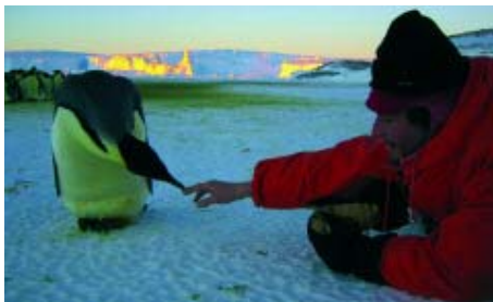
Begegnung der dritten Art: Pinguine sind ziemlich zutraulich und knabbern schon mal an einem Menschen rum.

Wie dreht man einen Film im ewigen Eis? Um «Die Reise der Pinguine» zu machen, erbrachte das Team eine Meisterleistung in Sachen Logistik und Technologie. Sie entwickelte neue Geräte, um den Pinguinen möglichst nahe zu kommen. Und manchmal gabs ordentlich kalte Füsse. Bilder von der Arbeit der Filmer.