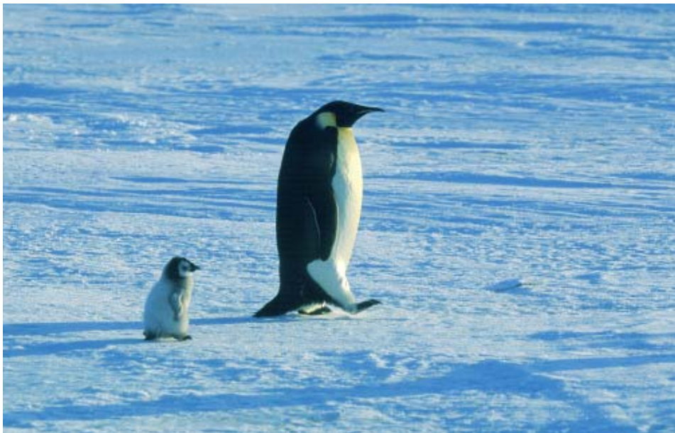
Wo du hingehst, da will ich auch hin: Pinguinbabys bleiben immer dicht bei ihren Eltern, wenn sie nicht gerade den Kindergarten besuchen.