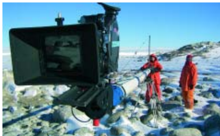
Mechanisches «Tele»: Dieses Gestell ermöglicht grossräumige Panorama-Schwenker mit der Kamera.