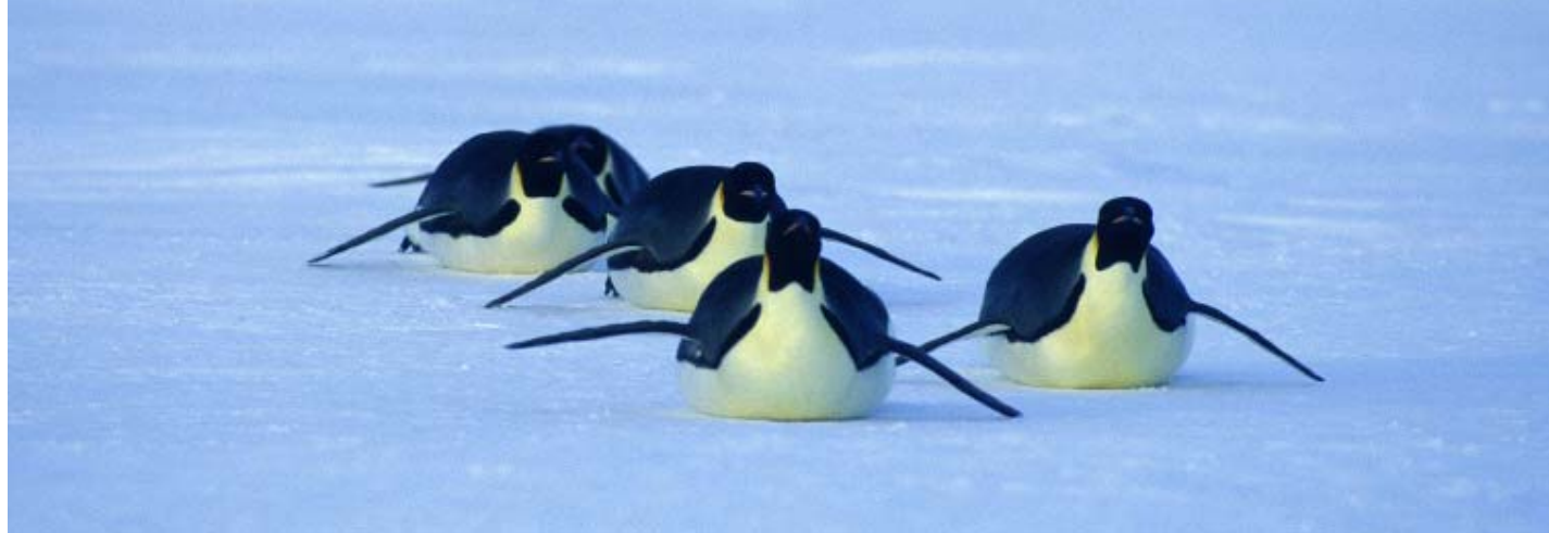
Schlitteln selbstgemacht: Um auf dem langen Weg bis ans Meer Energie zu sparen, schieben sich die Kaiserpinguine auf dem Bauch liegend übers Eis.

Rund drei Kilogramm vorverdauten Fisch bringen die Eltern von ihren Ausflügen ans Meer für ihre Küken. Der Fisch wird im Kropf «zwischenlagert». (rechts)