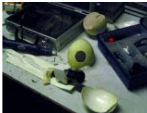
Für Nahaufnahmen: Ein Pinguinei wird zur Kamera umgebaut.