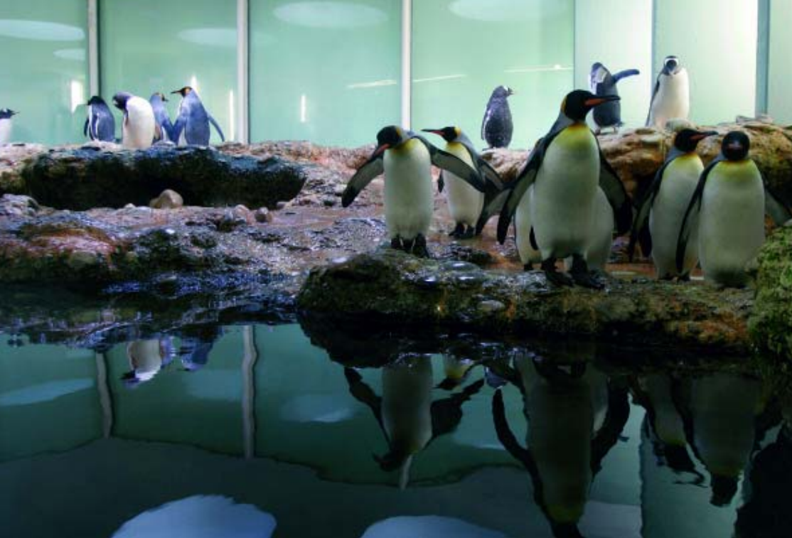
Zurzeit leben 13 Esels- und elf Königspinguine in der 6 auf 10 Meter grossen Anlage des Basler Zoos. «Das ist für ein Herdentier wie den Pinguin eine optimale Grösse», sagt Bruno Gardelli. Das Wasserbecken ist 4 Meter tief, es wird zwei- bis dreimal täglich mit Grundwasser umgewälzt.

Von Christian Hug (Text)